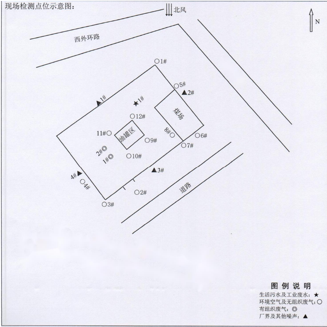
现场检测点位示意图：